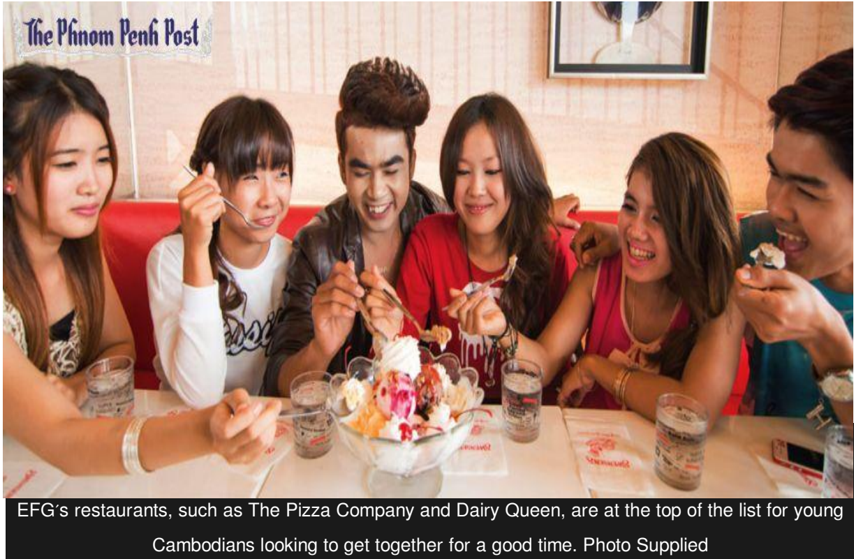
EFG's restaurants, such as The Pizza Company and Dairy Queen, are at the top of the list for young Cambodians looking to get together for a good time.