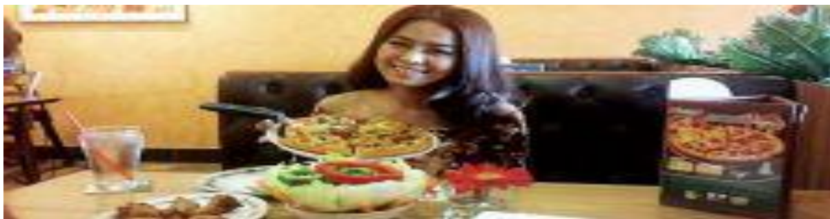
A Cambodian pop star enjoys a meal at The Pizza Company.

of customers. The wellbeing of its staff is one of EFG's main aims, because it is the company's goal to be productive and this can only happen if its workforce is content.