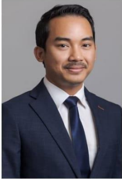
ឱន ស៊ីង អគ្គលេខាធិការ