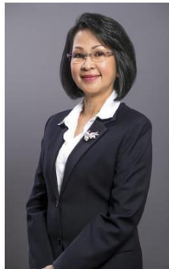
អនុប្រធាន ខៀវ ហានី