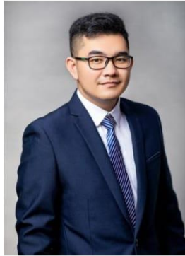
យុត ឧត្តម មន្ត្រីផ្នែកច្បាប់