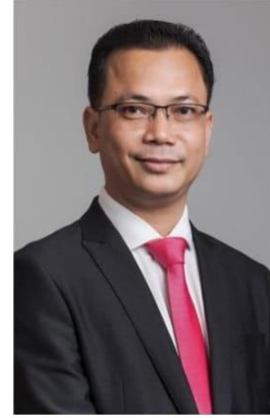
អគ្គហេត្រួត ហ្វុន សុខសីម