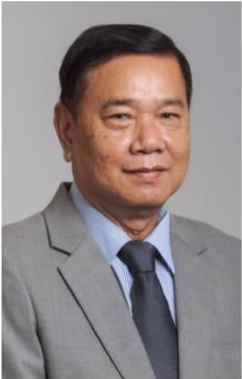
សមាជិក គុយ នាម